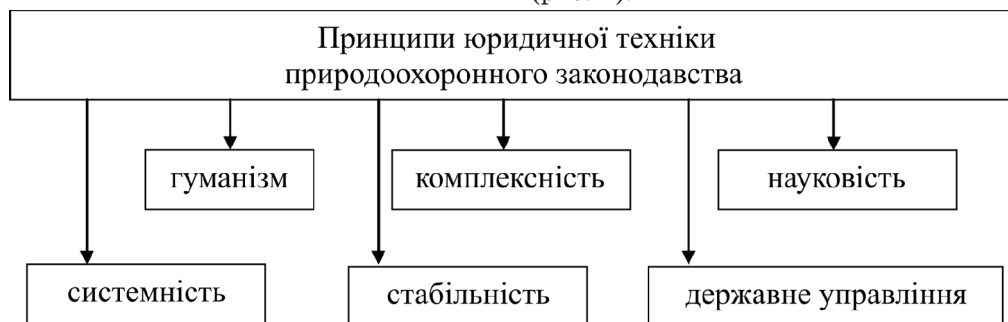
Рис. 1. Принципи юридичної техніки природоохоронного законодавства.

Алгоритм реалізації принципів юридичної техніки природоохоронного законодавства містить декілька етапів: світоглядне формування в суспільстві необхідності вирішення конкретної природоохоронної проблеми, що вимагає свого законодавчого регулювання та законодавчої формалізації таких положень. В юриспруденції під принципами права розуміють основні положення та ідеї, які виражають сутність і соціальну обумовленість права, а їх зміст має важливе значення для правотворчої і практичної діяльності. Принципи пронизують усі правові норми, являють собою важливий елемент нормативно-правових актів, визначають положення, які лежать у їх основі. Як вказує А. М. Колодій, принципи права виконують нормативно-регулятивні функції, тобто набувають значення загальних правил поведінки, яким властивий загальнообов'язковий державно-владний характер [12, с. 27]. Розглядаючи зміст юридичної техніки природоохоронного законодавства, можна віднести до їх числа наступні: 1) гуманізм; 2) комплексність; 3) науковість; 4) системність; 5) стабільність; 6) державне управління (рис. 1).